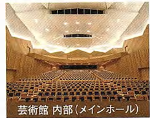
芸術館 内部(メインホール)