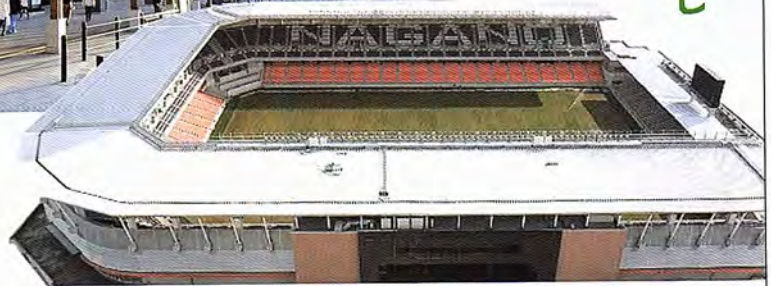
南長野運動公園 総合球技場 「長野Uスタジアム」