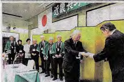
近畿県人会 110万円寄付 近畿長野県人会は26日、台風19号災害の県内被災地への義援金110万246円を県に寄付した。大阪市内で開いた