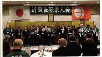
「信濃の国」を斉唱(壇上)