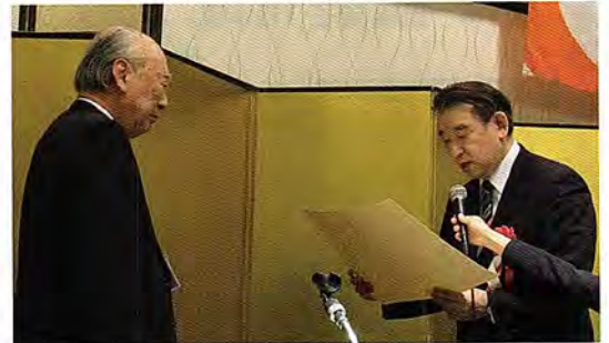
副知事から感謝状を授与