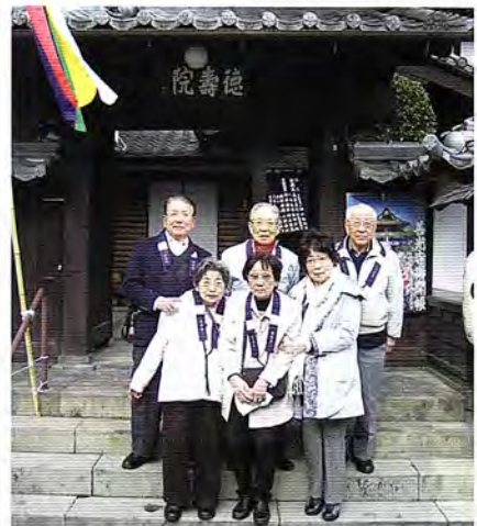
宿坊「徳寿院」の前で・後列左が筆者

和光寺と同じ住職の尼寺、京都市東山区の「得浄明院」(浄土宗総本山・知恩院に隣接)は「信州善光寺京都別院」として1894年(明治27年)に建立、善光寺の一光三尊阿弥陀如来の分身を安置し、善光寺同様の戒壇めぐりもあり、花菖蒲(イチハツ)はじめ四季折々の花咲く「花の寺」として知られており、信州長野まで行けない関西以西の方には観光方々お詣りするお奨めの寺である。当寺とのご縁もあるのでご紹介等もします。(飯田市出身)