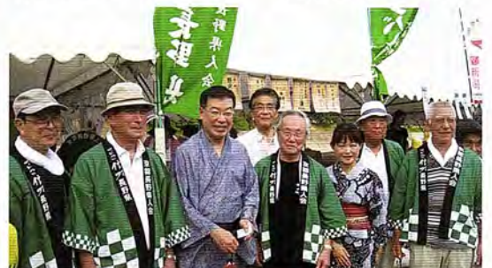
京都府知事がブースを巡回

37℃を超えた日中の日差しがようやく落ちると、薄暮の川面で「京の友禅流しファンタジー」が始まります。川床沿いに並んだ旧暦の七夕飾りが涼風にそよぎ、鴨川納涼の催しに彩(いろどり)を添えていました。今回の訪れでは、京の夏らしい夕べを過ごさせていただきました。なお、京都長野県人会の皆様には大変お世話になり、有難うございました。(長野市松代町出身)