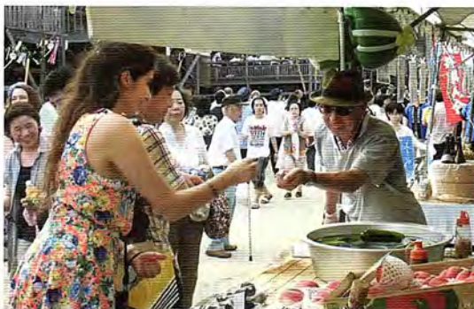
八町キュウリやモモを販売